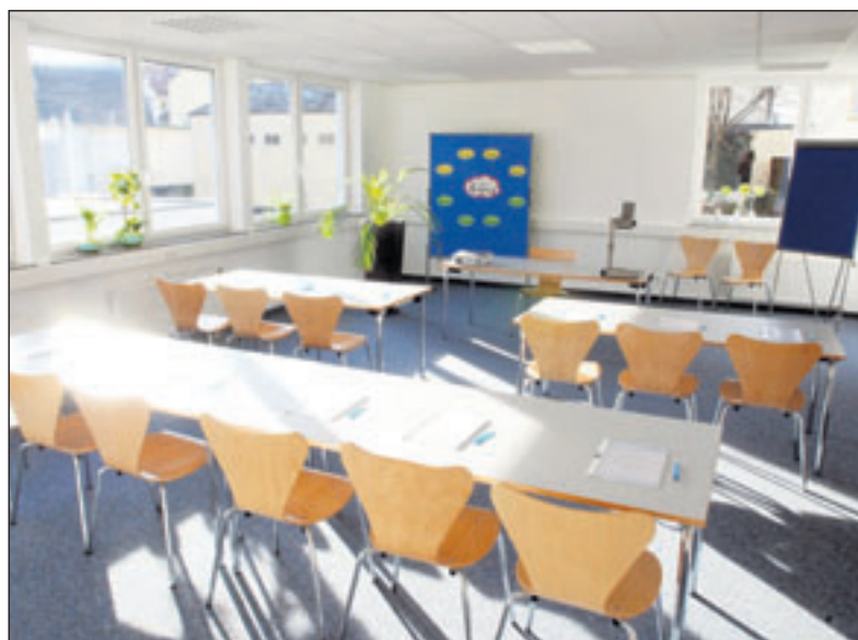
Der großzügige Seminarbereich.