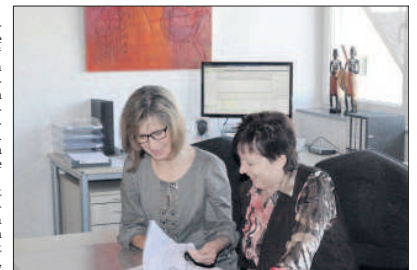
Kurze Wege und langjährige Erfahrung zeichnen die Kanzlei aus.

Selbstverständlich beinhaltet dies auch ein umfangreiches Aus- und Weiterbildungskonzept für die Mitarbeiter sowie regelmäßige gemeinsame Projekte wie etwa ein Werteseminar,